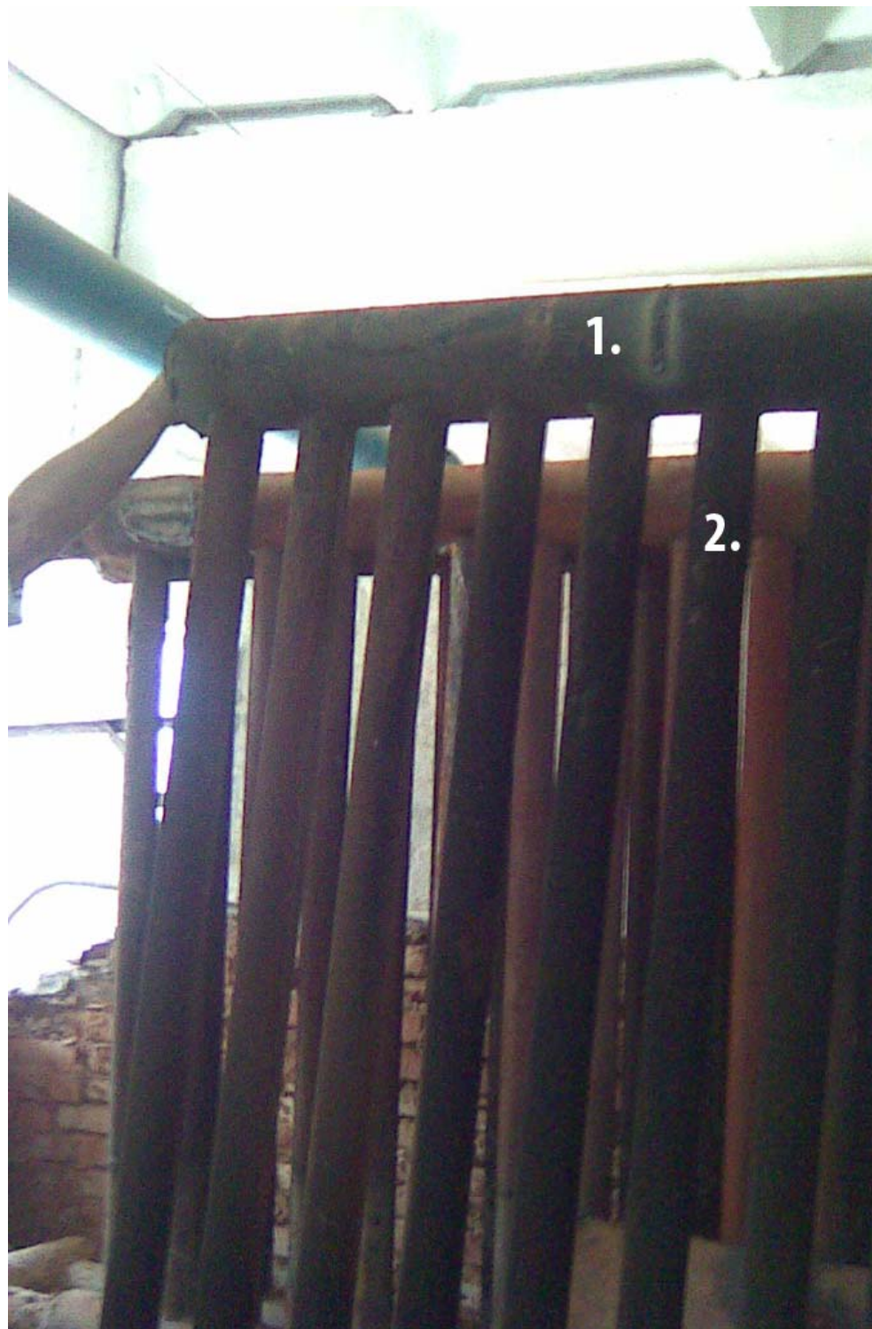
Теплообменник котельной. Цифрами 1 и 2 указаны места срезов.